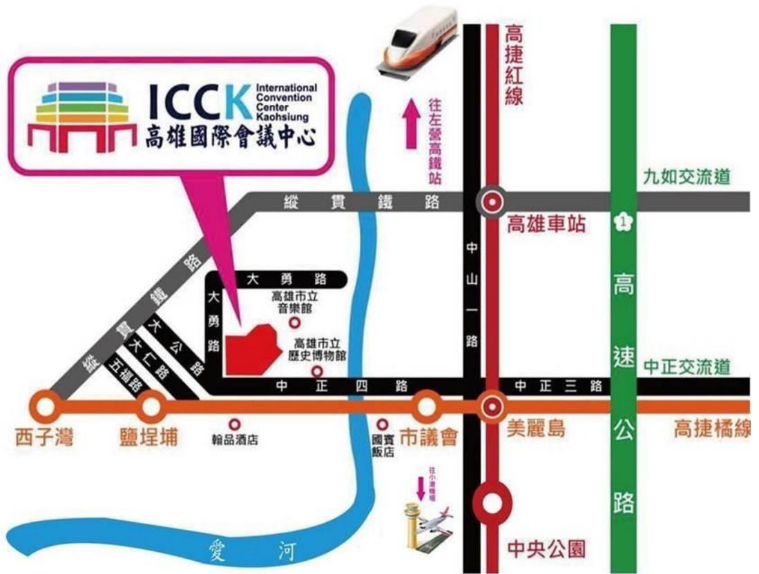
高雄國際會議中心(高雄市鹽埕區中正四路 274 號)